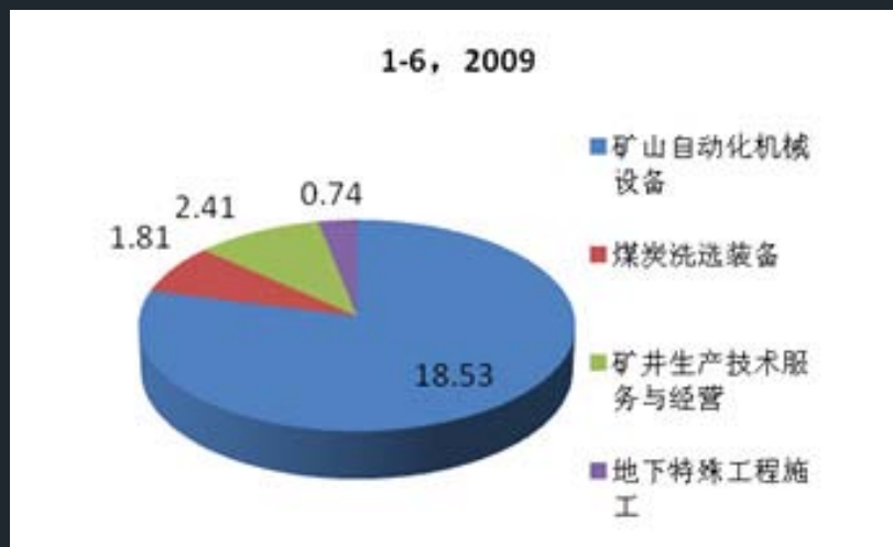
图： 2009年上半年天地科技主营产品营收对比