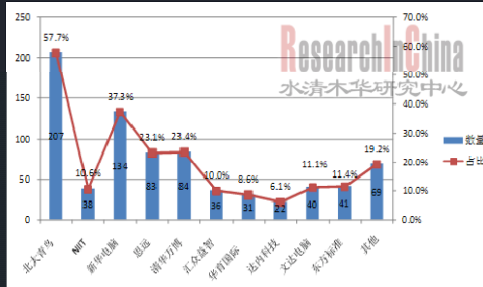
图：消费者选择培训机构情况的调查结果