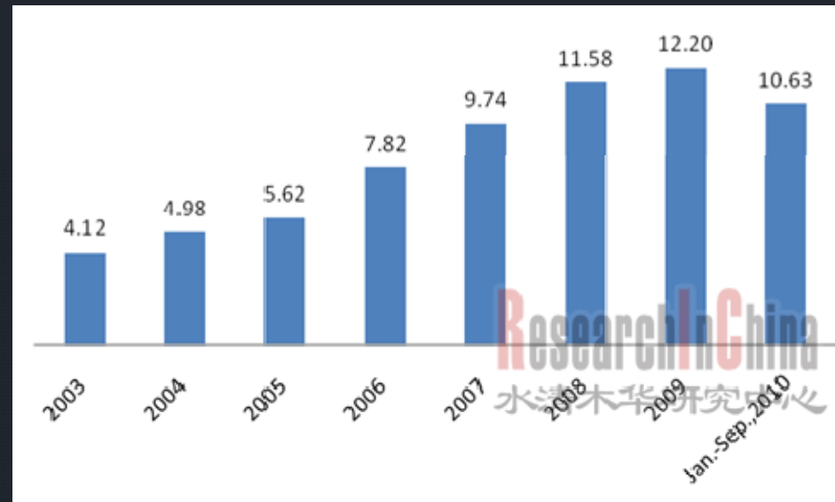
图：2003-2010年中国主要内河港口集装箱吞吐量 (m TEU)