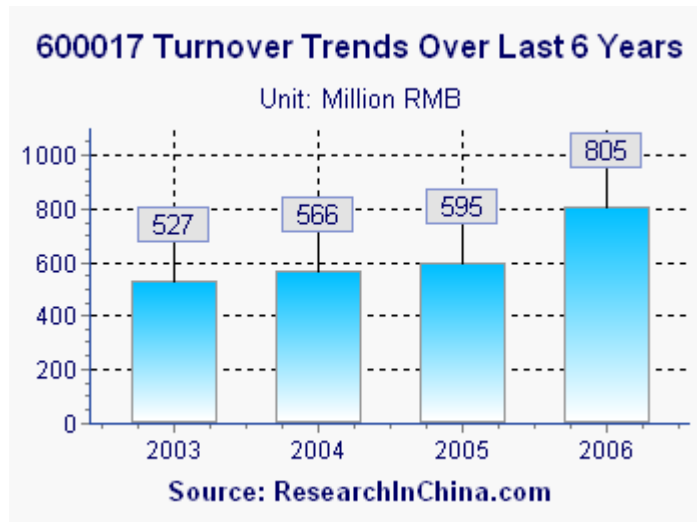
2001—2006 年日照港的营业额走势图

截至 2007 年 7 月, 在中国内地上市的物流类公司有日照港、上港集团、上港集箱、中海发展、南京水运、长江投资、铁龙物流等。本报告具体研究了中国 29 家港口和物流类上市公司的整体对比分析、业绩表现、运营情况和投资情况等, 并对主营构成和最新市场动向作了详细分析。