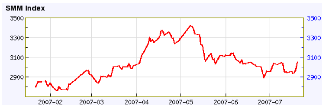
上海有色金属价格指数

2007 年以来，有色金属价格持续高企，表现明显好于年初时的预期。全球主要研究机构纷纷上调了对 2007、2008 两年的价格预测。出于对全球经济放缓的担忧，主要研究机构对未来两年的价格预测仍较为保守，并普遍认为未来价格将呈回落趋势。我们认为未来两年主要有色金属供应仍将难以满足需求的增加，加上库存仍处于历史低点，有色金属价格的牛市行情将会延续。